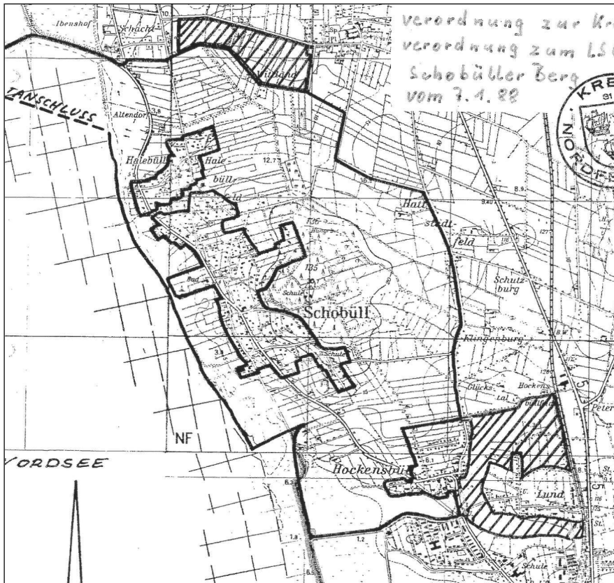
und in den heutigen Abgrenzungen. Die bebauten Ortslagen wurden 1983 herausgenommen, die schraffierten Gebiete kamen 1988 hinzu.